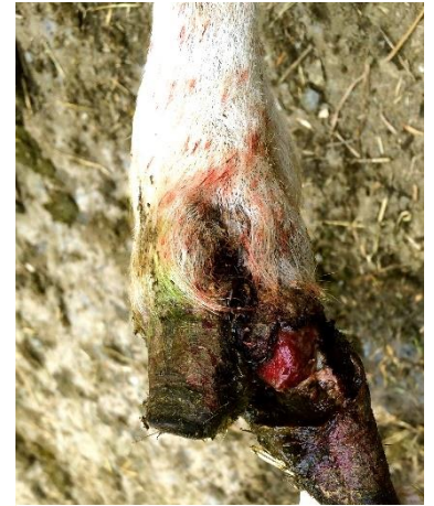
CODD – Llun gan Joseph Angell